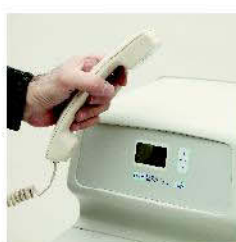
SISTEMA EASE, permite el diagnóstico telefónico del equipo