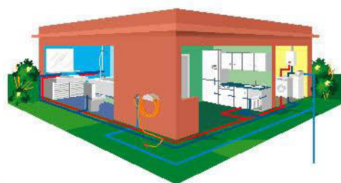
Esquema de instalación doméstica