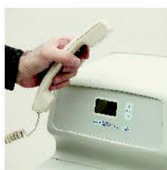
SISTEMA EASE, permite el diagnóstico telefónico del equipo